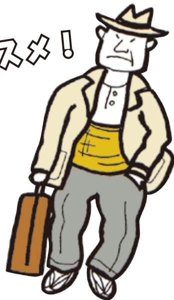
フーテンの寅さんもお腹を守っていたんだな～

朝晩の冷え込みが気になって来ました。これからの寒さ対策、カラダは内からと外からも守ってください。その冷え対策としてカラダの外から守る「腹巻」のご紹介をします。「おなかは原始の脳」と言われ、おなかで血液が作られるとも言われています。また、お腹には胃腸、腎臓や肝臓などの大事な内臓がいくつも集まっており、お腹が冷えると多くの内臓を冷やし、免疫力が落ちることにつながります。温めることでその分、内臓もしっかりと機能することが出来て、病気の予防にもつながると言えます。