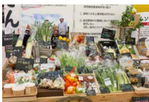
ムソーのオーガニック野菜が始まりました

り食べても安心で料理にも使える重曹なのです。他の化学合成された重曹との違いや、実際の使い方などもお客様にご説明しました。