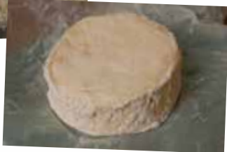
ウオッシュタイプ 価格未定