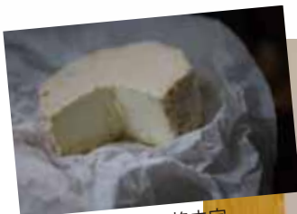
白カビタイプ 価格未定