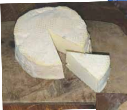
フロマージュ・ブラン 1個 ¥890 税込