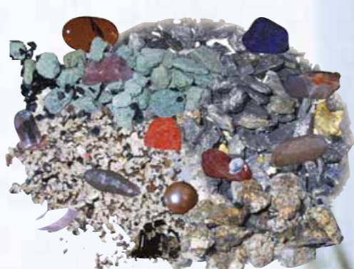
エリクサーには宇宙を再現したかのような思想設計・構造・内部ろ材が搭載されている

医師がサジを投げた植物人間状態から、エリクサー水を飲ませ始めて僅か数週間で意識が戻り、やがて合唱を再び指揮をするまでに