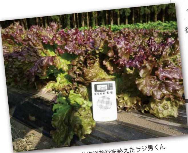
無事、北海道旅行を終えたラジ男くん